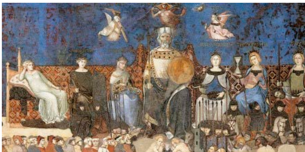
Slika 3: Ambrogio Lorenzetti: detalj s freske "Alegorija dobre vlasti"

Da je dobra vladavina u Sijeni u 14. stoljeću bila jedna od najznačajnijih političkih ideala govori i činjenica da je sama vlast tog vremena naručila ove freske kao podsjetnik na potencijalne posljedice sopstvenog (ne)rada. Mehanizmi borbe protiv nepravde i loše vladavine u Sijeni išli su do te mjere da su se devetorica članova Gradskog vijeća smjenjivala svaka dva mjeseca kako bi se potpuno umanjio rizik od korupcije. 4 Kad je oko 1339. godine Lorenzetti naslikao ove najznačajnije freske iz Sijene, one su prvenstveno imale političku i didaktičku svrhu, predstavljajući opće dobro kao temelj dobre vladavine u talijanskim gradovima-državama. 5