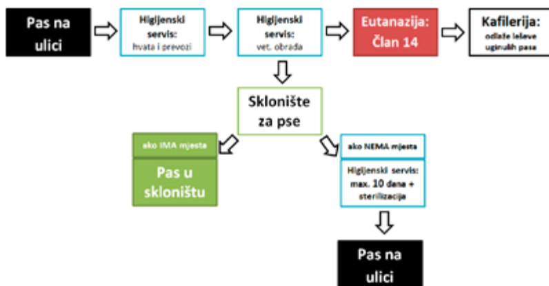
Grafikon 1: Funkcionalni sistem zaštite i zbrinjavanja napuštenih pasa

Zakon i podzakonski akti koji su doneseni odmah sljedeće godine, 2010., podrazumijevali su između ostalog uspostavu funkcionalnog sistema zaštite i zbrinjavanja napuštenih životinja, tj. pasa.