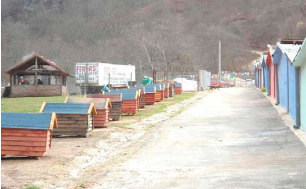
Slika 5: Kantonalno sklonište za pse "Prača" u Prači, 39 km udaljeno od Sarajeva

Vlasnik i direktor Murai komerca, Muriz Alić, tvrdi da je sklonište investicija od 1,4 miliona KM 36 te da u okviru skloništa postoji registrirani higijenski servis, veterinarska služba, hladnjak za leševe pasa, dakle sve što predviđaju zakon i pravilnik 37 kao i 15 uposlenih, uključujući veterinara i veterinarske tehničare.