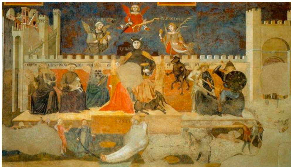
Slika 1: Ambrogio Lorenzetti: detalj s freske "Alegorija loše vlasti"

U središtu je Tiranija, odjevena u crno, s očnjacima i rogovima, s bodežom u ruci. Okružuju je Okrutnost, Izdaja, Prevara, Bijes, Razdor i Rat. Pohlepa, Ponos i Oholost lete nad njom, i svi skupa vladaju predjelom gdje je zemlja jalova, grad propada, a narod gladan, siromašan, pati i sukobljava se. Ovo je slika 1 Ambrogia Lorenzettia, 2 jednog od najznačajnijih talijanskih slikara iz Sijene, koja prikazuje posljedice loše vlasti. Naslikao ju je kao jednu u seriji od tri freske u Salonu devetorice. 3 Scena samog grada odaje nesklad: ništa nije kao što bi trebalo biti. Grad je u ruševinama, prozori zjape otvoreni, kuće su urušene, a privreda gotovo da ne postoji. Ne radi ništa osim oružarnice. Ulice su napuštene.