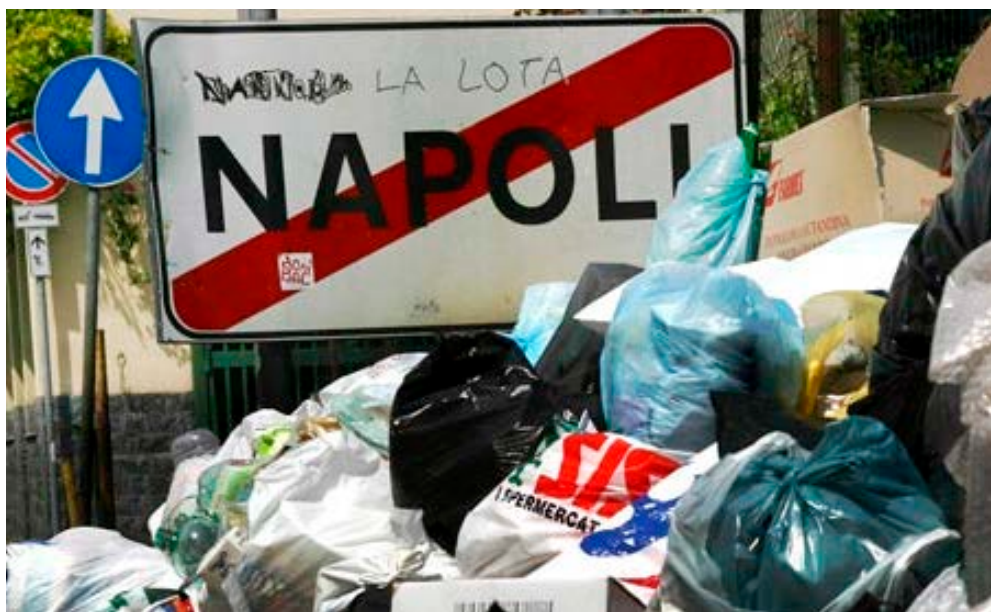
Slika 4: Gomile smeća na ulicama Napulja, 2007.

Sedam stoljeća nakon Lorenzetta, u Italiji, ali i širom svijeta, politički oportunistam i zanemarivanje općeg dobra ključni su uzroci loše vlasti. Napulj, treća općina po veličini u Italiji, od 1994. godine se bori s problemom odlaganja komunalnog otpada. Nekoliko faktora, a među njima iskorumpiran i problematičan sektor upravljanja otpadom, odbijanje komunalnih radnika da sakupljaju smeće, te politička nesposobnost, uzrokovali su eskalaciju problema i vanrednu situaciju u nekoliko slučajeva kada su radnici odbili da odvuku smeće na prepune deponije. Zimu 2007/2008. godine u Napulju su obilježile plastične vreće smeća koje su poplavile ulice i trgove, a otrovni i medicinski otpad ležao je uz glavne gradske ulice. Zrak, zemlja, i voda -- sve je bilo zagađeno, građanima Napulja zdravlje je bilo ugroženo, dok su svo to vrijeme redovno plaćali sve veće cijene za sve lošije usluge.