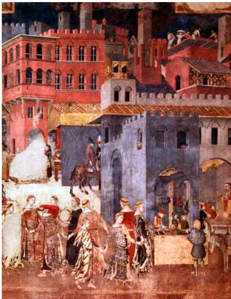
Slika 2: Ambrogio Lorenzetti: detalj s freske "Uticaoj dobre vlasti na grad i državu" (Izvor: Web Gallery of Art)

Ljudi žure, proizvode, kupuju i prodaju. Trgovine su otvorene, mame raznovrsnošću proizvoda. Svadba je u toku, a djevojke plešu na ulicama, koje su, iako užurbane i pune svijeta, uredne i sigurne. Cijela scena odaje ambijent blagostanja i prosperiteta koji je moguć isključivo zbog dobre vlasti koju je Lorenzetti predstavio na trećoj freski – "Alegorija dobre vlasti".