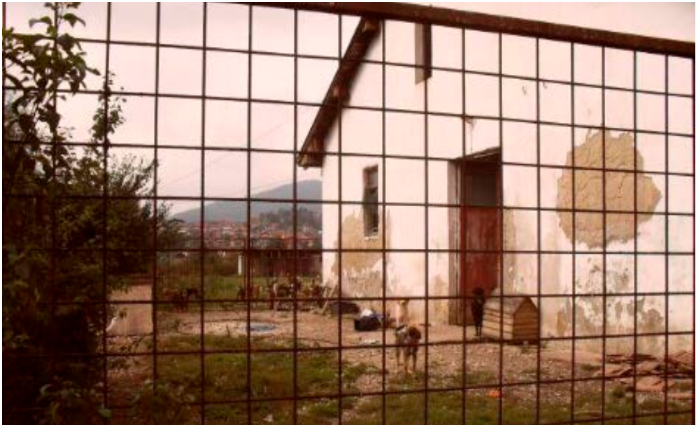
Slika 6: Zemljoradnička zadruga "Iliđža" -- Sklonište za pse, Gladno Polje

Jasno je na prvi pogled da je ovo daleko od "skloništa" za životinje: