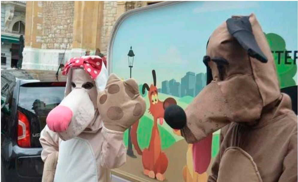
Slika 7: Dogs Trust je slikanjem građana s maskotama obilježio prvu polovinu kampanje masovne sterilizacije pasa

Da li je Dogs Trust svojim radom stvarno doprinio smanjenju broja pasa na ulicama nije poznato, ali je evidentno da je nezadovoljstvo građana naraslo do mjere da je Kanton Sarajevo u septembru 2014. ponovo inicirao rješavanje problema napuštenih pasa na nivou kantona.