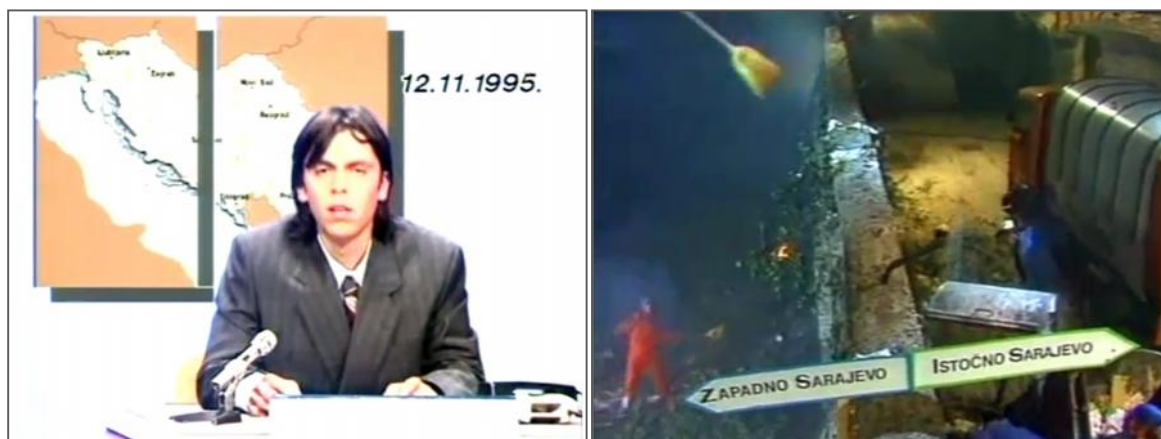
Slike iz skeča „Top liste nadrealista“ iz 1989.

U humorističkoj seriji „Top lista nadrealista“ iz 1989. godine koja se prikazivala na TV Sarajevo, autori su prikazali svoje satirično viđenje političke realnosti u budućnosti. Skeč je imitacija dnevnika datiranog šest godina u budućnost, – 12. novembra 1995. – a predstavlja Jugoslaviju nakon raspada, a bosanski glavni grad kao podijeljen na Istočno i Zapadno Sarajevo. Dva dijela su odvojena zidom, ali život se normalno odvija, dok se jedan dan ne desi greška u kompjuteru koji regulira smjene sakupljača smeća Istočnog i Zapadnog Sarajeva, koja dovede do toga da se oba tima nađu kod zida. Priča završava nasilnim sukobom među njima koji izbija na sarajevskom zidu.