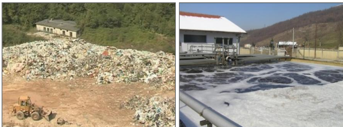
Haos nasuprot kontroli: deponija Krupac (lijevo) i sanitarna deponija Kantona Sarajevo (desno).

Logika diktira direktnu integraciju deponije u Istočnom Sarajevu u postojeće kantonalno područje s kojeg se sakuplja otpad, te iako su dvije uprave nekoliko puta sjedile i razgovarale o ovom problemu, dogovor nije postignut. 2005. godine su bili najbliži sporazumu kada su Grad Istočno Sarajevo i Kanton Sarajevo razmotrili modele rješavanja problema Krupac. Tada je dogovoreno da premještanje otpada sa deponije Krupac u Istočnom Sarajevu na kantonalnu deponiju u Sarajevu treba početi u julu 2006. Lokalna razvojna agencija SERDA osigurala je inicijalna sredstva u iznosu od oko 250.000 KM 35 , ali projekat nikada nije počeo. Sporazum nije potpisan, a jedan od kamena spoticanja bila je cijena odlaganja otpada za Istočno Sarajevo. 36 Komunikacija po ovom pitanju je od tada prestala. 37 Čini se da su trenutno i Kanton Sarajevo i Grad Sarajevo više zaokupljeni borbom za kontrolu nad prihodima od komunalnih usluga dok eko-katastrofa koja samo što se nije desila u predgrađu Sarajeva ostaje van fokusa jednostavno zato što je locirana na teritoriji RS.