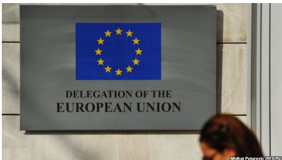
Zgrada EU u Sarajevu