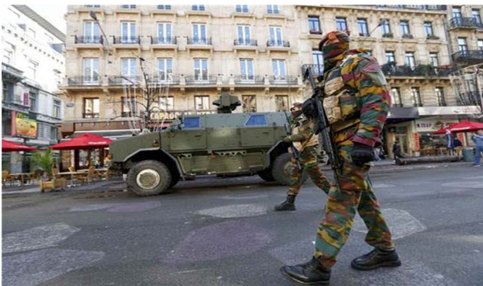
Slika 1: Belgijski vojnici patroliraju u centru Brisela nakon nedavnih smrtonosnih pariških napada

Nakon više smrtonosnih napada koji su se desili 13. novembra 2015. godine u Parizu, po drugi put u istoj godini, Francuska je poduzela izuzetne mjere sigurnosti. Ovaj put vlada je proglasila "vanredno stanje", dajući vlastima i policiji mnogo šire ovlasti. Parlament je vanredno stanje produžio na tri mjeseca. Sedmicu dana nakon ovog napada, i Belgija je usvojila vanredne mjere sigurnosti. Briselska regija je proglasila vanredno stanje zbog terorizma, koje se primjenjuje u slučaju "ozbiljne i neposredne opasnosti," a premijer Charles Michel upozorio je na opasnost od napada "sličnim onima u Parizu." 1 Kao posljedica navedenog, tokom četiri uzastopna dana, cijeli grad je bio "pod opsadom." Škole, fakulteti, vrtići, muzeji, trgovački centri, podzemna željeznica, sve je bilo zatvoreno. Javni događaji, poput nogometnih utakmica, su otkazani, a od stanovništva je zatraženo da izbjegavaju bilo kakve gužve poput komercijalnih zona, javnog prijevoza i koncertnih dvorana. Osim pružanja zaštite stanovništvu, zatvaranje objekata i otkazivanje događaja za cilj je također imalo izbjeći preopterećenost snaga sigurnosti. 2 Pojačani su kapaciteti i prisustvo policije i vojske, uključujući postavljanje oklopnih vozila u ključnim dijelovima grada. Stanovnici su izjavljivali da se osjećaju kao "pod opsadom," 3 a što su dočarale i slike vojnih vozila u centru Brisela.