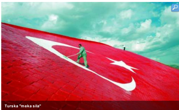
Turska "meka sila"

List navodi da turski šef diplomatije Ahmet Davutoglu rado pominje „zlatno doba“ Balkana sa Turskom