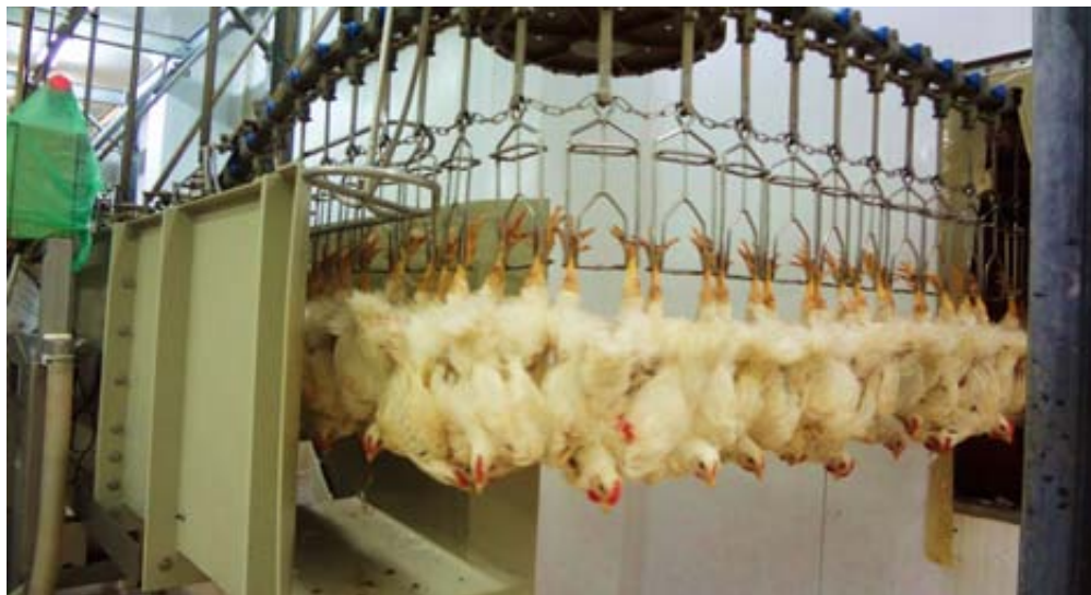
Brojelri iz depoa ulaze u klaonicu Brovis

blokiranja izvoza. Da li će ova konkretna lokalna priča nastaviti biti uspješna i nakon 1. januara?