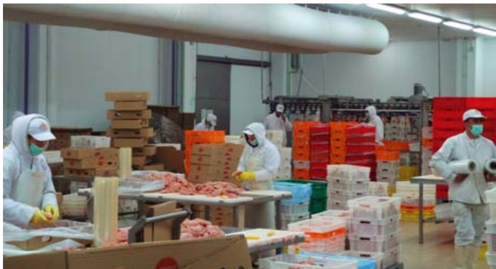
Pakirnica u Brovisu

Iako je higijenski paket usvojen nedavno, 29. oktobra 2012., implementacija je i dalje ogroman faktor. Usvajanje zakona ne potiče automatski njegovu implementaciju.